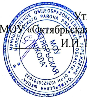
График посещения школьной столовой комиссией по контролю организации качества питания на 2024-2025 учебный год